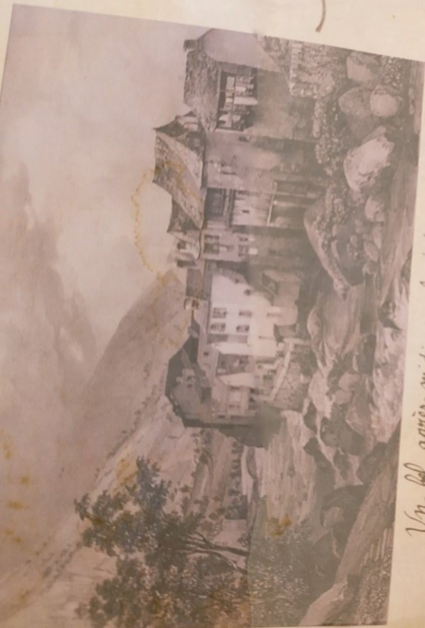
Un bel après-midi en bord de rivièra, le Gave.

Asseline Asseline Asseline Asseline Asseline